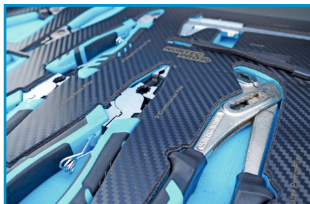
RÓŻNEGO RODZAJU SZCYPCE