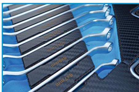
KLUCZE OCZKOWE ORAZ PŁASKIE