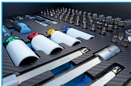
KLUCZE NASADOWE ORAZ BITY

Wózek narzędziowy Nortec WN359XXL to profesjonalne wyposażenie warsztatowe, zawierające aż 359 elementów , które zapewniają wszechstronność i funkcjonalność. W skład zestawu min. wchodzi: nasadki , wkrętaki, szcypce , klucze płaskie i oczkowe, wybijaki , klucze imbusowe, klucz dynamometryczny oraz nasadki na klucze udarowe . Wózek wyróżnia się solidną konstrukcją i stabilnością, co czyni go wyjątkowo odpornym na obciążenia i intensywne użytkowanie . Szafka narzędziowa posiada system cichego domykania szuflad , a także wygodę w użytkowaniu oraz przechowywaniu narzędzi.