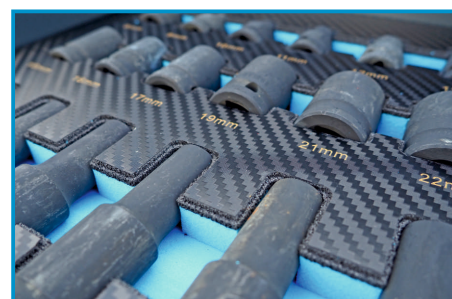
NASADKI NA KLUCZ UDAROWY