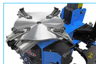
Profilowany stół montażowy od 10" do 24"