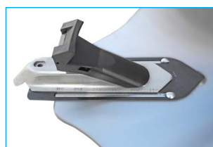
Dodatkowe ślizgi szczęk, oraz dysze inflatora