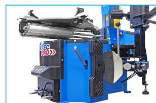
Mocny zbijak o sile 3 ton