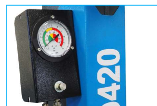
Metalowa skrzynka z manometrem