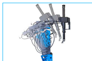
Pneumatycznie odchylenie ramię szersze u podstawy