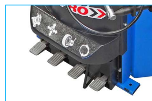
Podwójna prędkość obrotowa stołu, sterowana w pedale