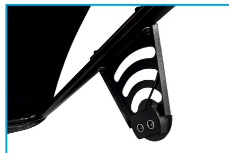
SONAR DO POMIARU SZEROKOŚCI OBRĘCZY