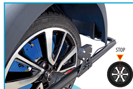
AUTOMATYCZNE POZYCJONOWANIE KOŁA W MIEJSCU NIETYWAŻENIA

Wyważarka przeznaczona do wyważania kół samochodów osobowych oraz lekkich dostawczych ♦ automatyczny pomiar odległości koła od wyważarki i średnicy obręczy przy pomocy wysuwanej miarki ♦ pomiar szerokości koła automatyczny za pomocą sonaru ♦ automatyczne pozycjonowanie koła ♦ aktywny kaptur ochronny, automatyczne hamowanie koła, programy: statyczny, dynamiczne oraz ALU ♦ hamulec elektryczny ♦ hamulec nożny ♦ wyważanie komputerowe ♦ funkcja szybkiej optymalizacji, dzielenia niewyważenia i ukrywania ciężarków za ramionami obręczy ♦ możliwość zmiany jednostek: cal/milimetr oraz gram/unjca, auto-diagnoza i program do kalibracji.