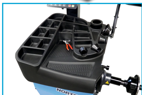
WYGODNA KASETA NA NARZĘDZIA